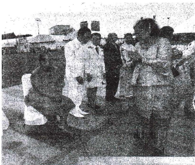
๒๙ พฤษภาคม ๒๕๕๘ พระครูศรีชยาภินันท์ ถวายพระพรแด่ สมเด็จพระเทพรัตนราชสุดาฯ สยามบรมราชกุมารี ทรง สู่หรัยข้าวมธุปายาส (ข้าวทิพย์) งานวิสาขบูชา งานเทศกาล วันวิสาขบูชา วันสำคัญสากลของโลก และวันอัฐมีบูชา ณ มณฑลพิธีท้องสนามหลวง เป็นปีที่ ๓๐